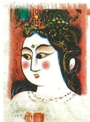
(問 10) 《弁財天妃の柵》