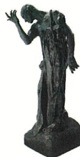
(問 20) 《ピエール・ド・ヴィッサン》