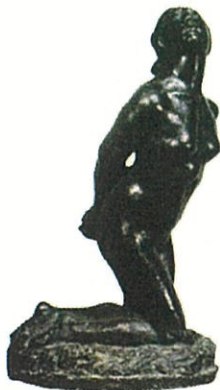
(問 9) 《女》